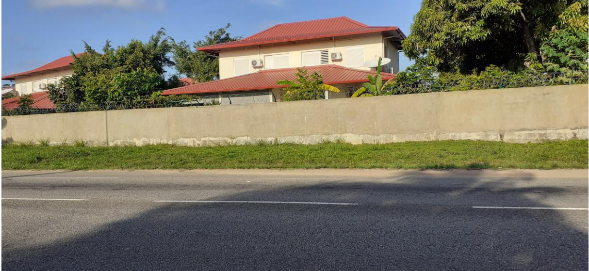
Vue du Mur longeant la D2